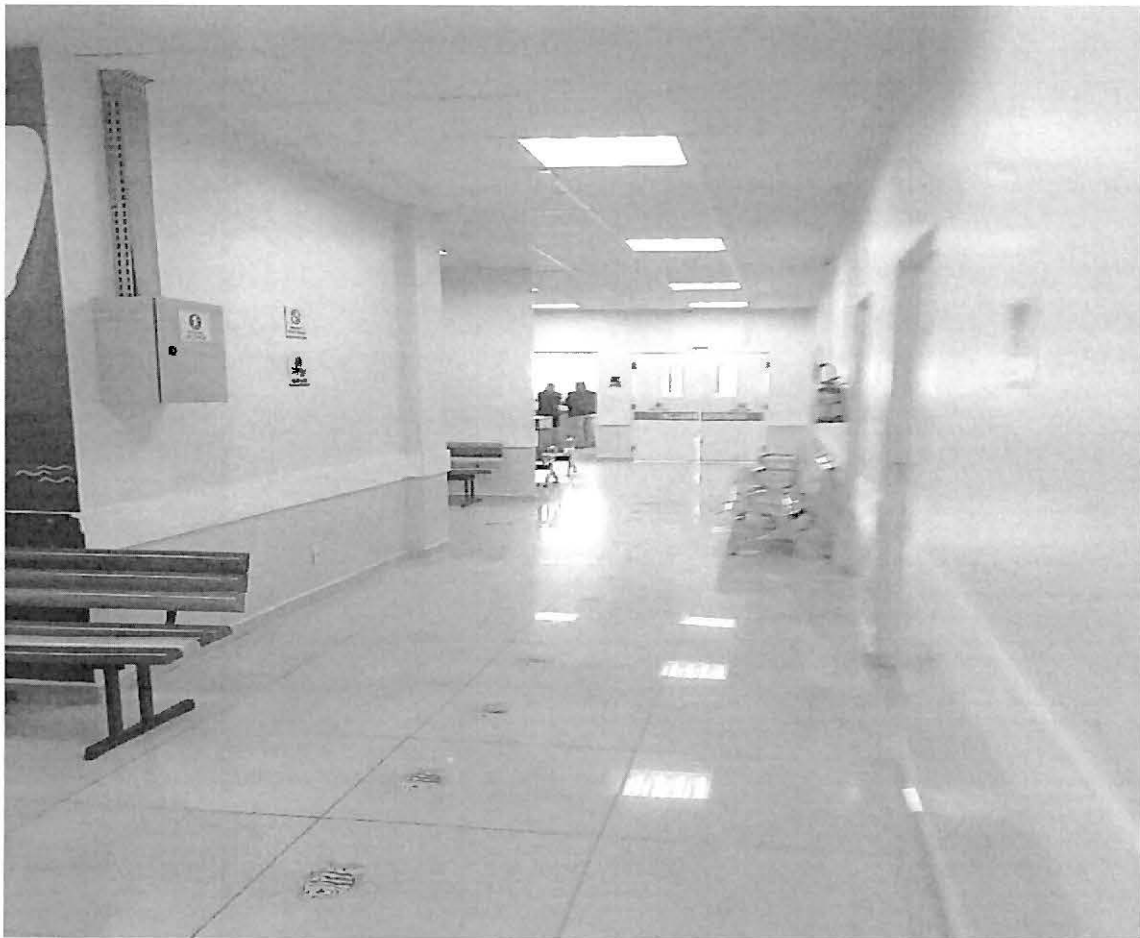
PS - INFANTIL

Em relação ao PS-Infantil, durante a visita de inspeção, foi detectado que a unidade de saúde funciona de forma amplamente favorável. Não foram constatadas filas, muito pelo contrário, o tempo de atendimento dos pacientes girava em torno de 25 minutos, sendo que na unidade haviam 2 pediatras atendendo no momento da visita.