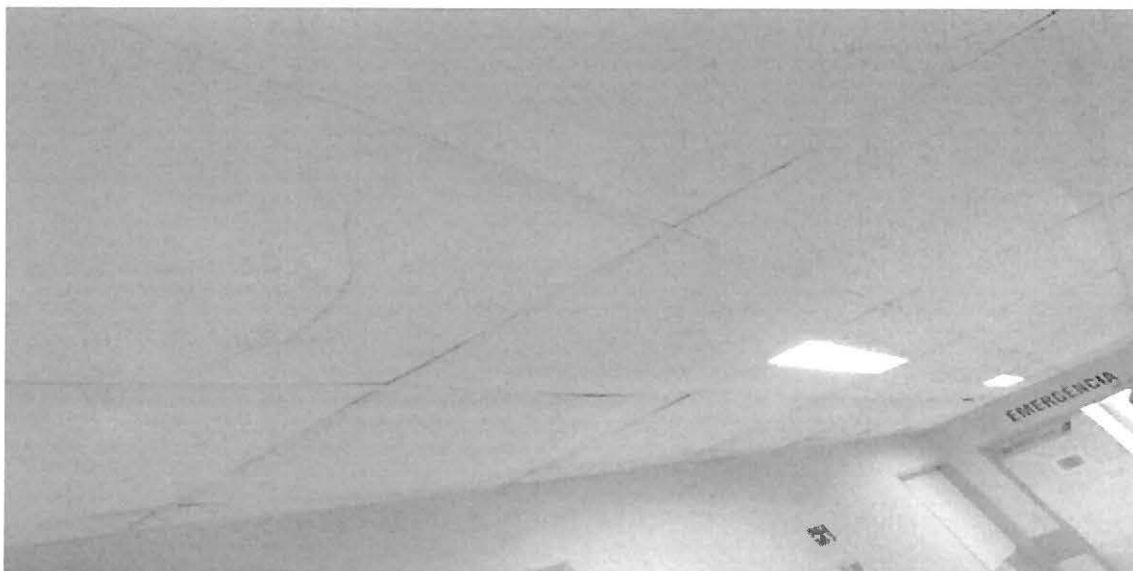
corredor da ala adulto

Foram detectados problemas no forro da unidade que apresentavam placas disformes nos corredores da ala adulto e principalmente na sala de raio X.