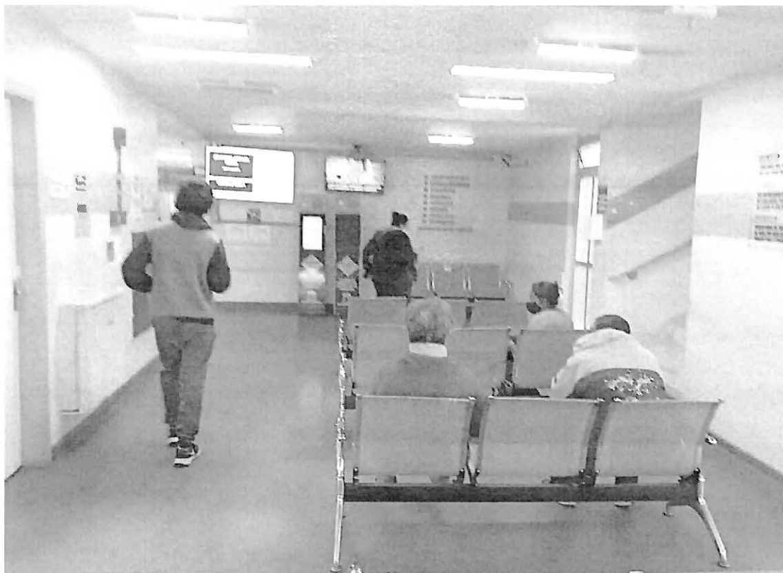
PAM SANTANA - dia 11/10

No dia da segunda visita 13/10 o movimento de pacientes no PAM SANTANA estava acima do normal, pois segundo a diretoria administrativa houve acúmulo de consultas no setor de ortopedia devido à emenda de feriado.