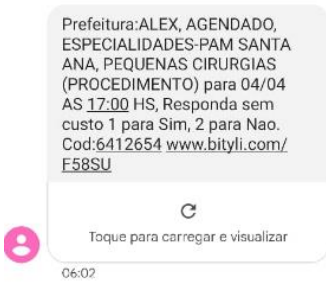
Imagem 3 - mensagem recebida pelo paciente contendo opção de confirmação por acesso ao link do sistema do Call center .

3) Confirmação por envio de SMS: o sistema realiza o envio das mensagens SMS massivas e complementares aos pacientes entre 06h e 22h, que por sua vez interagem com o sistema, confirmando comparecimento na consulta através do link enviado na mensagem ( imagens 3 e 4 ) assim marcando a consulta como "confirmada" ou "desmarcada";