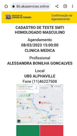
Imagem 6 – Tela sistema do CallCenter contendo os dados da consulta: Especialidade, data, hora, profissional, localização e dados de contato da unidade no link enviado na mensagem SMS(sem confirmação da consulta);