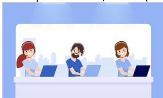
Imagem 8 - representação do Call center/unidade de saúde recebendo a informação sobre atualização de status da consulta e gravando no sistema;

4) Confirmação receptiva: Recebe ligação do paciente para agendar, desmarcar e consultar agendamentos/filas através dos sistemas municipais SisSaude, SisPAB (contato através de número a ser disponibilizado pelo Call Center 0800 e 4004);