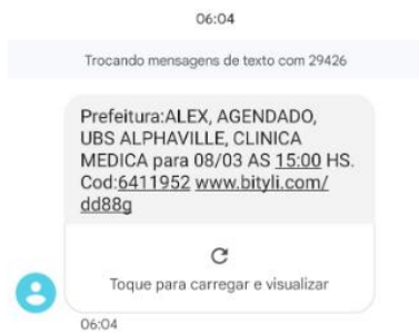
Imagem 5 - SMS recebido pelo paciente contendo com link para visualização de detalhes da consulta (sem confirmação de presença).