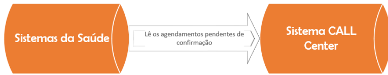
Imagem 1 - representação sistema do Call center consultando dados no sistema de saúde

1) O Sistema de CALL Center copia a lista de consultas com mensagens pendentes de envio;