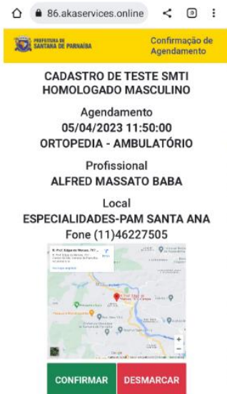
Imagem 4 – Tela sistema do CallCenter contendo os dados da consulta: Especialidade, data, hora, profissional, localização, dados de contato da unidade no link enviado na mensagem SMS, com a possibilidade de confirmar ou desmarcar a consulta;