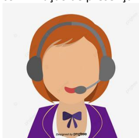
Imagem 6 - representação do Call center entrando em contato com o paciente para confirmar consulta

3.1) Confirmação ativa: se no registro de agendamento do envio da mensagem SMS, houver a informação como requerido “ com resposta ” estiver sido lida pelo sistema mas o paciente não responder ao SMS/link, o CALL Center realiza contato telefônico para confirmação de presença na consulta. Podendo ser como resposta: consulta confirmada ou consulta cancelada pelo operador.