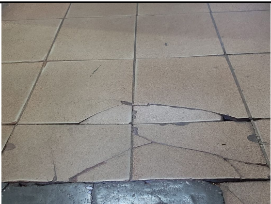
Solapamento no piso