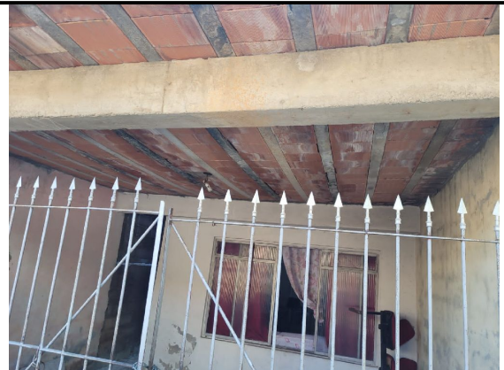
Vigotas da laje enferrujada e e laje colapsando.