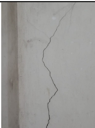
Trinca na vertical