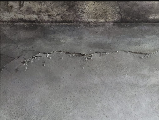
Trincas na horizontal