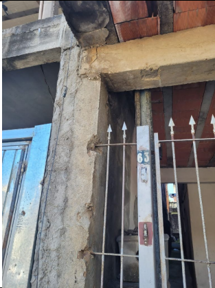
Viga de sustentação da laje trincada