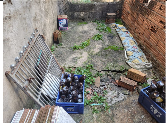
Fossa com afundamento de solo