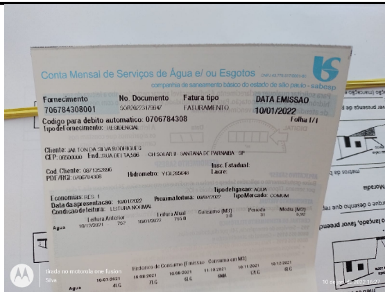
Endereço do local de origem do deslizamento