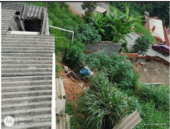
Acúmulo de lixo e entulho