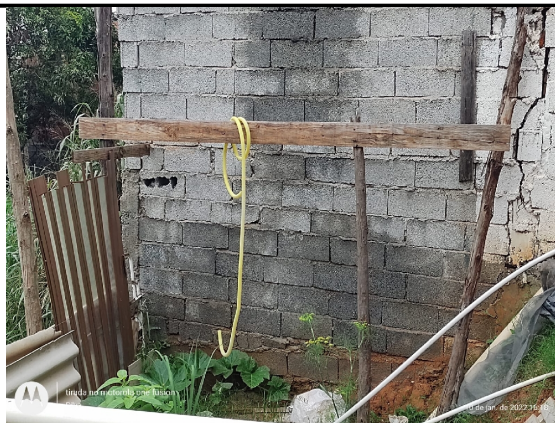
Casa origem do deslizamento