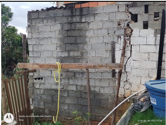
Rachadura de tração de movimento do solo