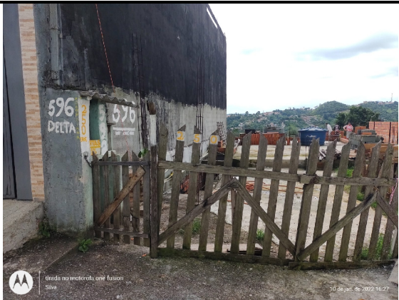
Frente do local de origem do deslizamento