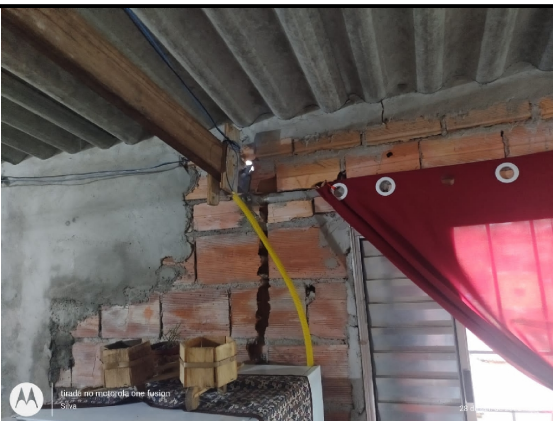
Rachaduras na área de serviço