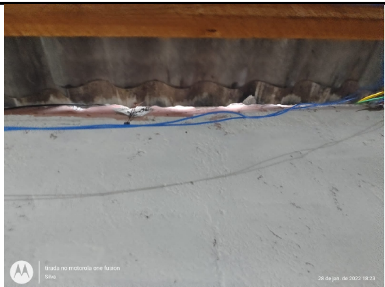
Deslocamento do telhado da área de serviço