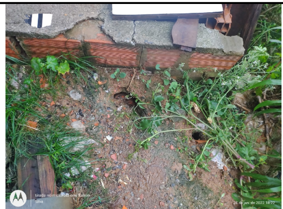
Fisuras no solo