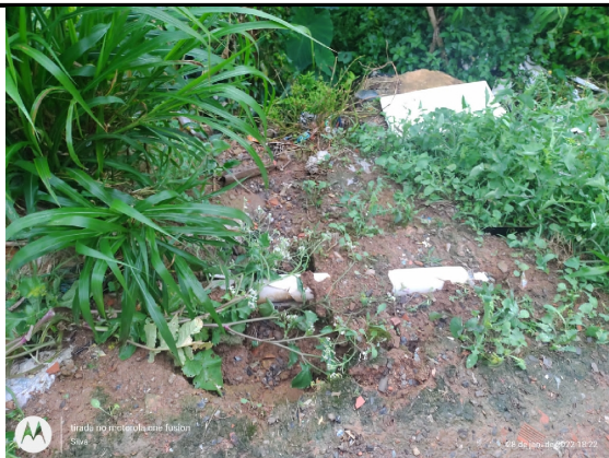
Presença de lançamento de Águas servidas no talude