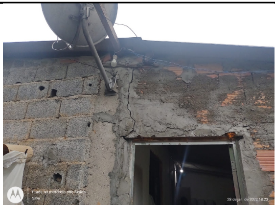
Trincas na entrada do imóvel