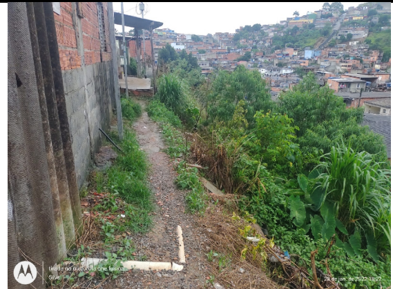
Proximidade com talude lançado