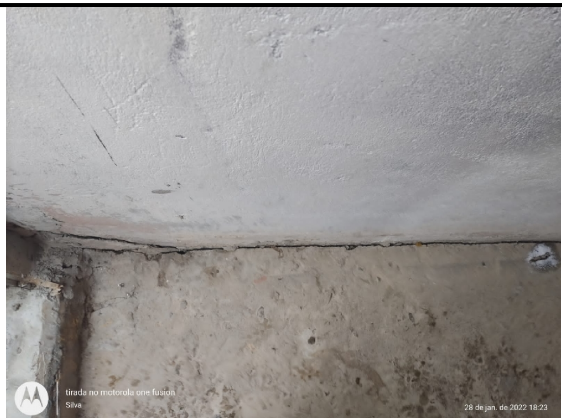
Trincas de movimento do solo