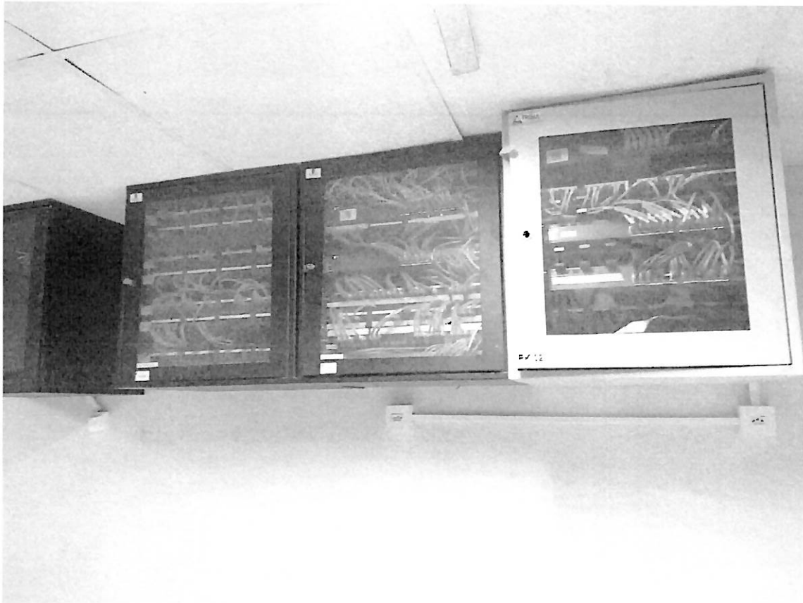
SISTEMA CORRIGIDO APÓS 1 SEMANA DA INSPEÇÃO